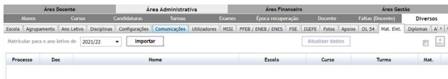
Fig. 1 Importar o ficheiro .xml do Portal das Matrículas

A importação do ficheiro (de formato .xml) do Portal das Matrículas, contendo os dados quer dos alunos colocados quer dos respetivos encarregados de educação (EE), faz-se no separador [Área Administrativa » Diversos » Mat. Elec.] (fig. 1).