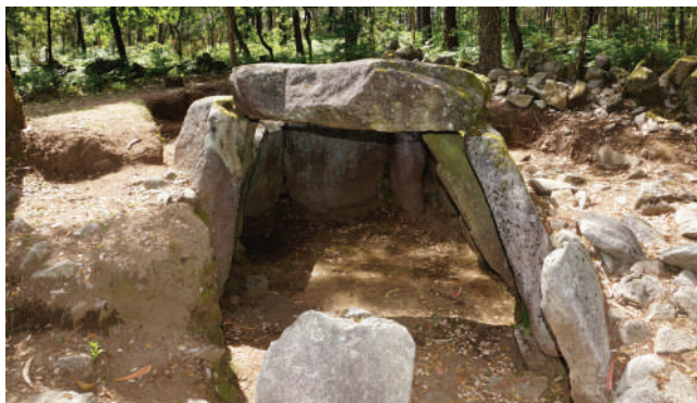
DÓLMEN DA PORTELAGEM