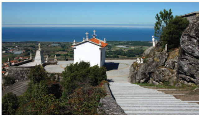
SANTUÁRIO DA SENHORA DA GUIA