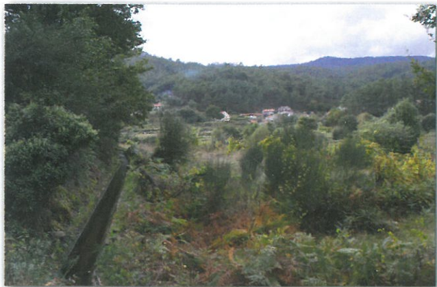
Levada e Aldeia de Parada

O percurso desenvolve-se por caminhos de acesso a terrenos agrícolas, acompanhando as levadas de regadios. A ligação entre a sede de freguesia (Couto de Cima) e a aldeia de Lourizela, faz-se por antigos caminhos de passagem dos funerais e das romarias (trilho das Fontanheiras/Vale da Mó), ao longo dos quais se podem observar vários exemplares de alminhas. Mais uma vez a fé religiosa e a crença de uma vida além-túmulo orientou o povo português na construção destes singelos monumentos e de pequenas capelas, como forma de sufragar e de auxiliar as almas dos seus mortos.