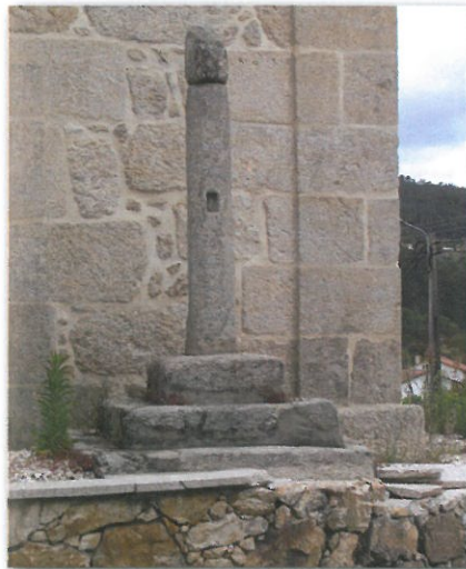
Pelourinho em Couto de Esteves