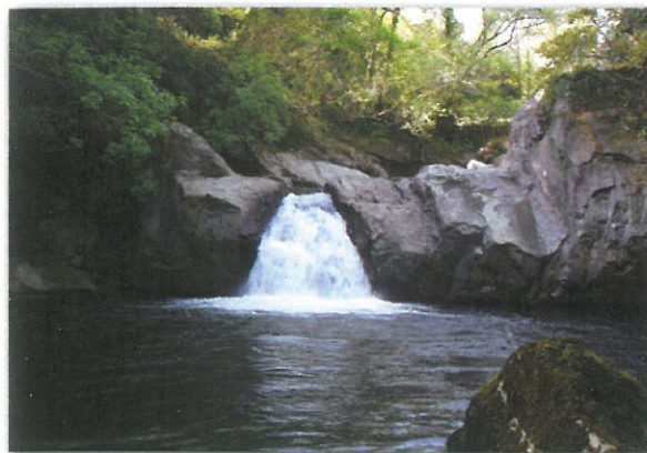
Poço do Pêgo Negro