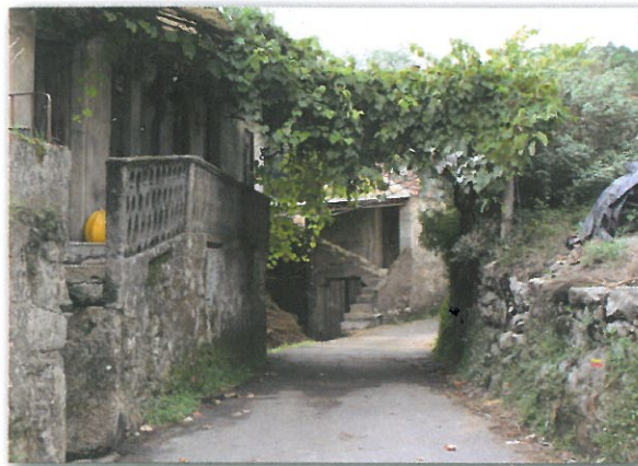
Aldeia de Parada