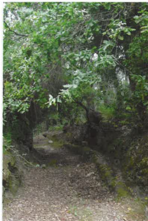
Caminho Tradicional por Carvalhal

Marcação, Sinalização e Conceção Gráfica: NaturBarroso www.termontalegre.net geral@naturbarroso.net Tel. 276 518 125 / 935 663 060/8