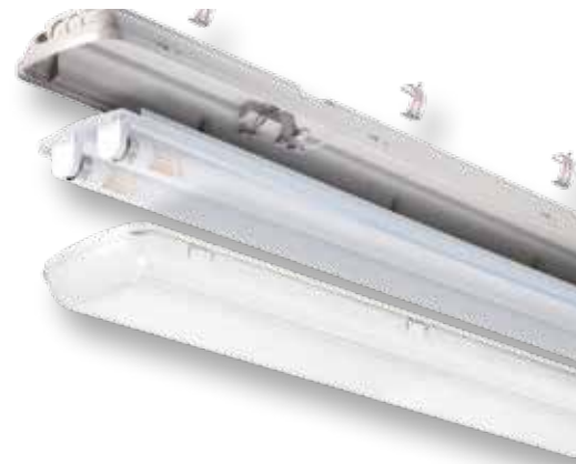
*Versiones de Policarbonato