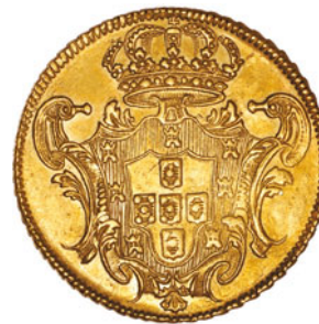
59* Ouro Dobra 1732 R 138.11/138.13 J5.37 Al 0227