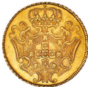
60* Ouro Dobra 1729 M 139.03a J5.26 Al 0285