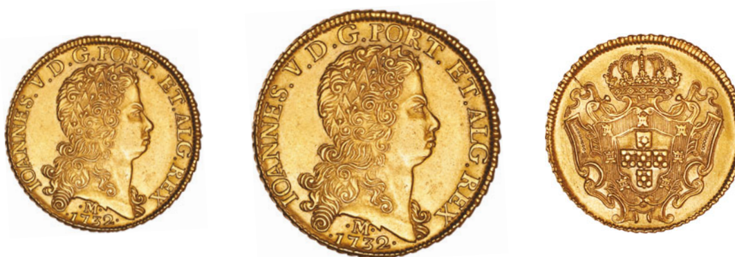
70* Ouro Dobra 1732 M 139.08 J5.29 AI 0288