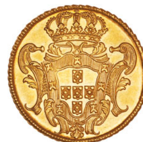
57* Ouro Dobra 1729 133.06 J5.13