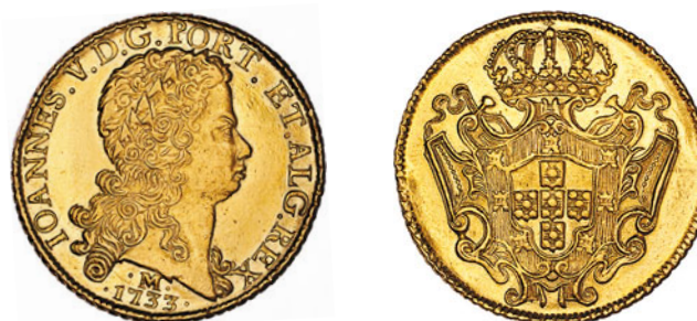
72* Ouro Dobra 1733 M 139.09 J5.30 AI 0289a retocada