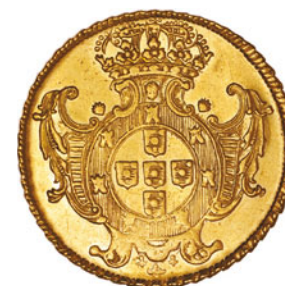
58* Ouro Dobra 1729 R 138.04 J5.33 AI 0195