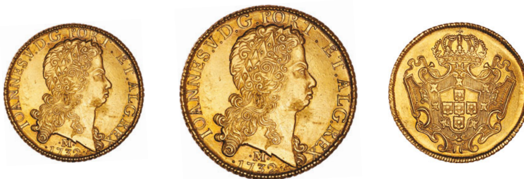
71* Ouro Dobra 1732 M 139.08 J5.29 AI 0288