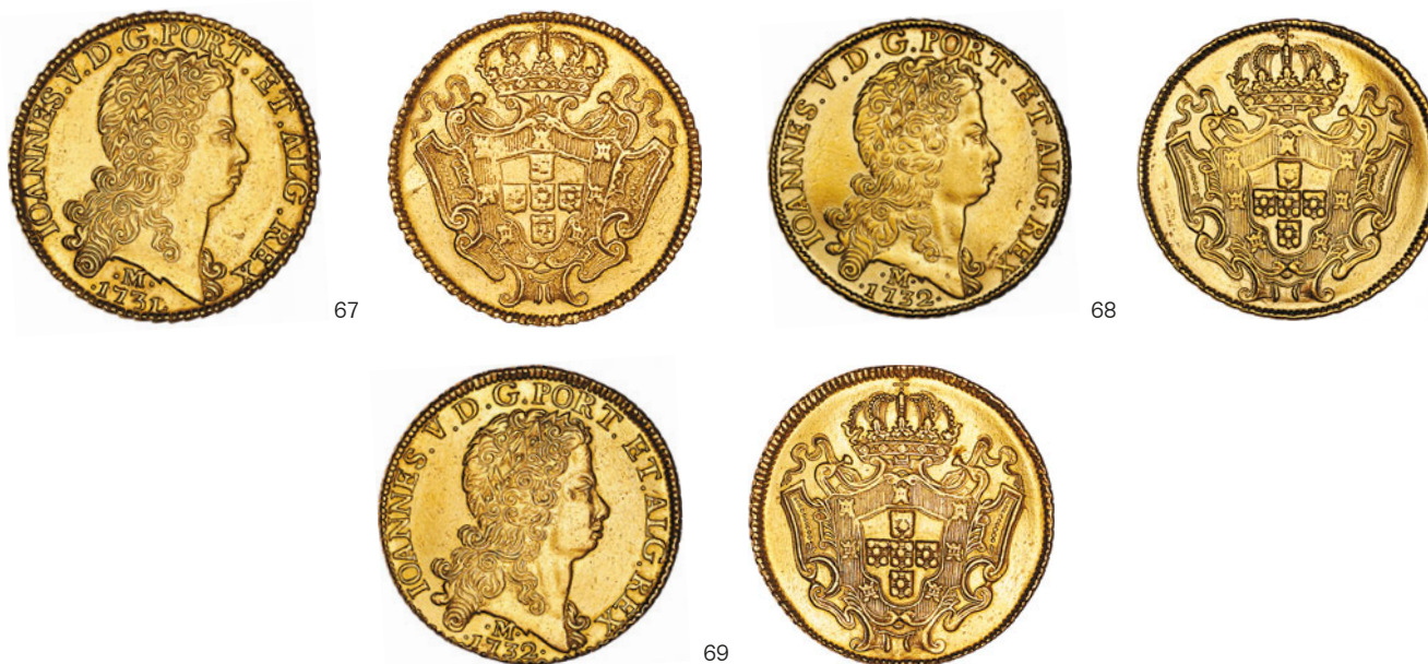
67* Ouro Dobra 1731 M 1/0 139.07 J5.28 AI 0287