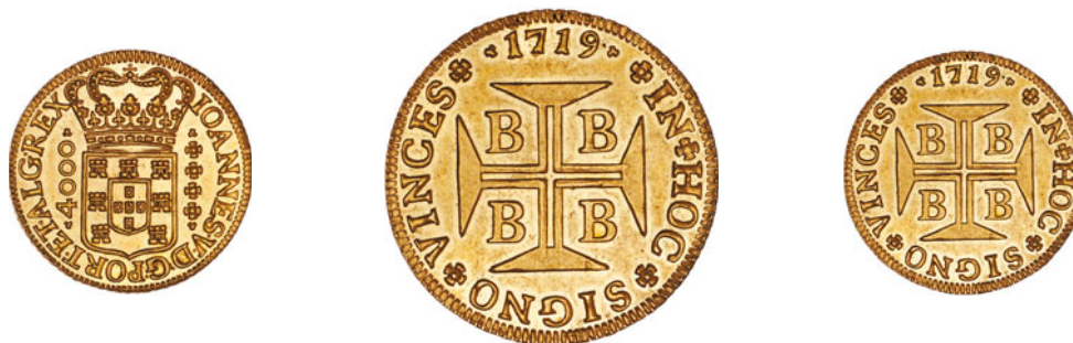
86* Ouro Moeda 1719 B 102.06 J5.156 AI 0065