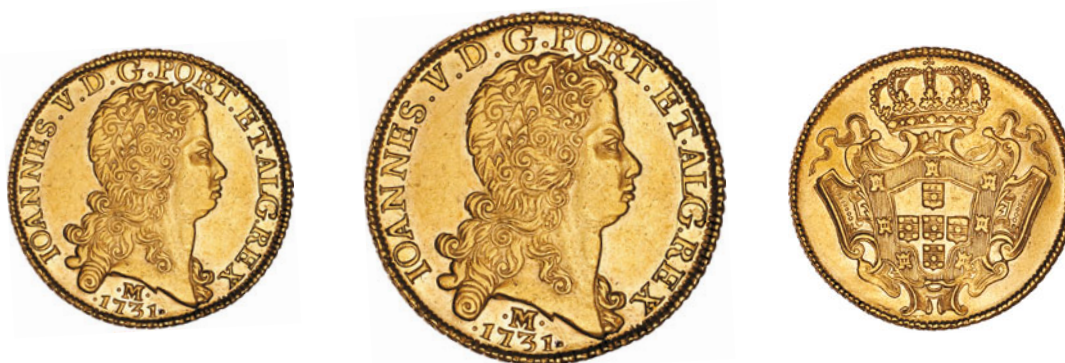
66* Ouro Dobra 1731 M 139.06 J5.28 AI 0287a