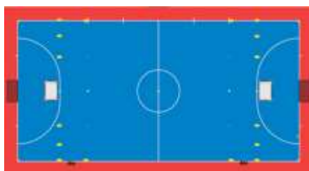
Exemplo A – 2/3/4 Clubes participantes