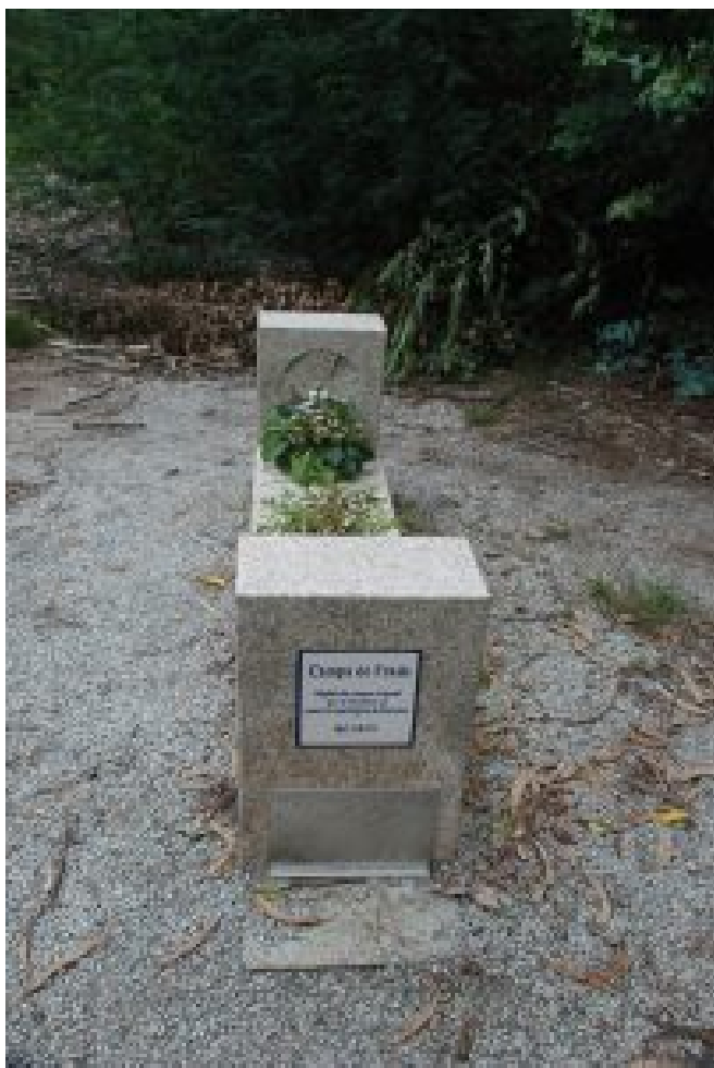
6 – Campa do Frade