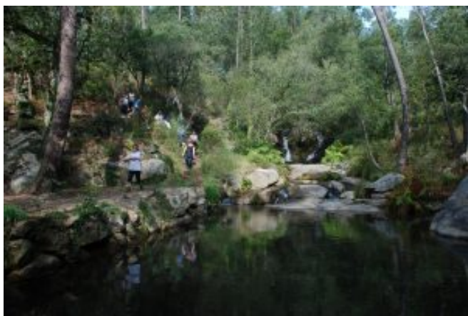
5 – Lagoas de Enxate