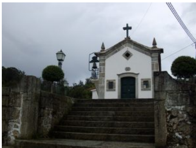
1 – Capela Nª Srª da Boa Morte