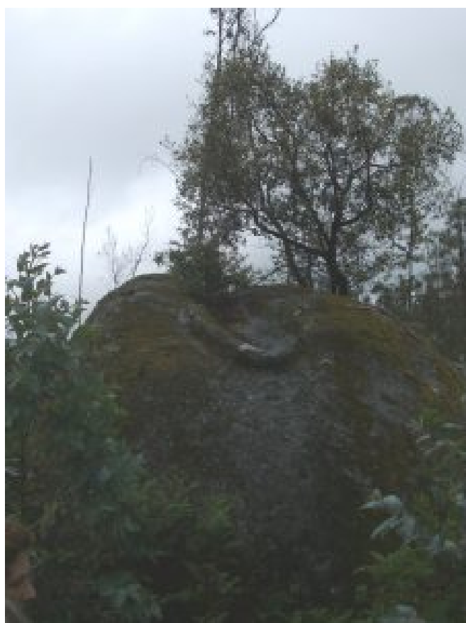
2 – Penedo do Ladrão