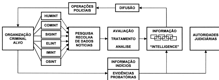
Figura 2 – Estratégia integrada de gestão de informações e operações