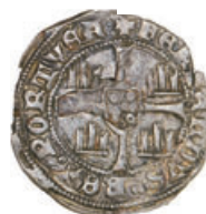
47* Meia Barbuda, Ç-A 28.01 b/s