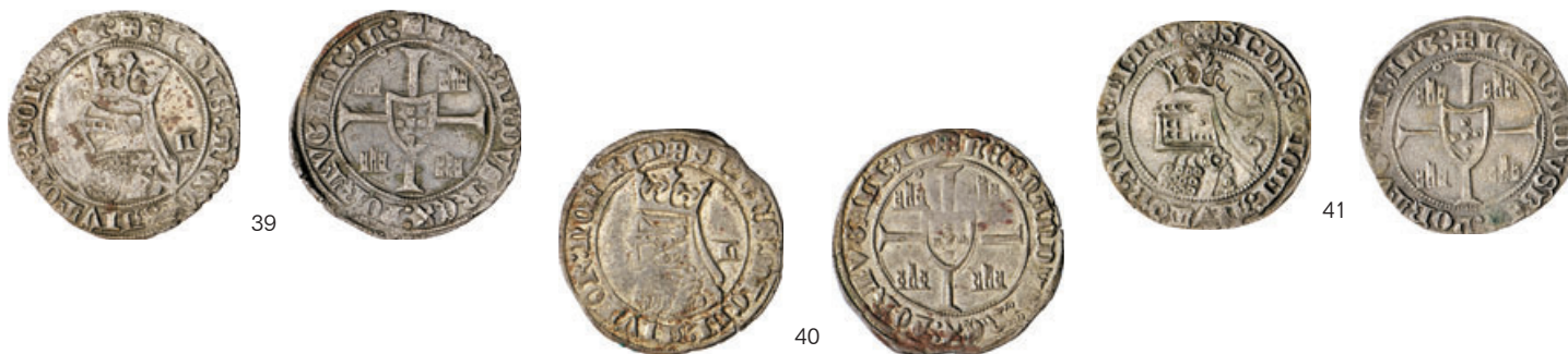
39* Barbuda, L MBC 300 33.01 ab/e