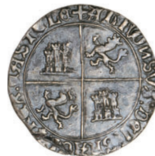
91* Real grosso 10 castelos, escudo de Castela e Leão dentro de círculo RARÍSSIMA lindo MBC 4000 34.03