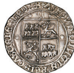
92* Real grosso \text{o}^{\text{t}}/\text{o}^{\text{D}} EXTREMAMENTE RARA MBC 7500 41.01/38.01var ligeiro restauro