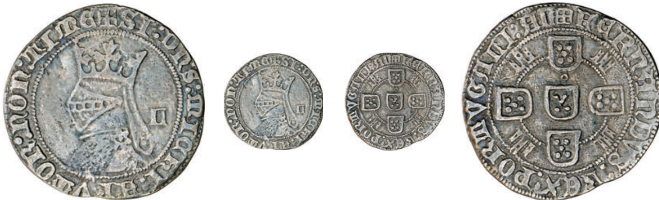
38* Barbuda, L escudetes, em cruz, cantonado por torres BC+ 2000 32.01 b/e MUITO RARA