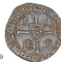
49* Barbuda CR-V 48.02 r/u