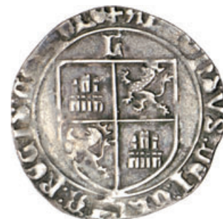
90* Real grosso o/L 10 castelos, armas de Castela e Leão MUITO RARA BC+ 2500 36.03/01 arco de círculo perolado no anverso e liso no reverso