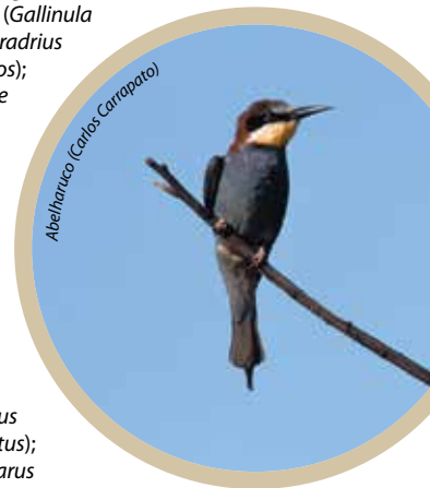
Abelharuco (Merops apiaster)

Libelinhas ( Erythromma lindenii , Coenagrion caeruleum ); Libellula quadrimaculata, Gomphus graslinii .