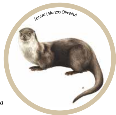
Lontra (Lutra lutra)