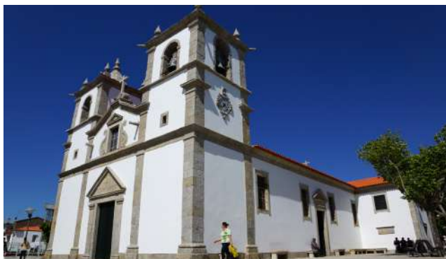
IGREJA MATRIZ DE ESPOSENDE