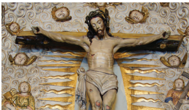
CAPELA DOS MAREANTES