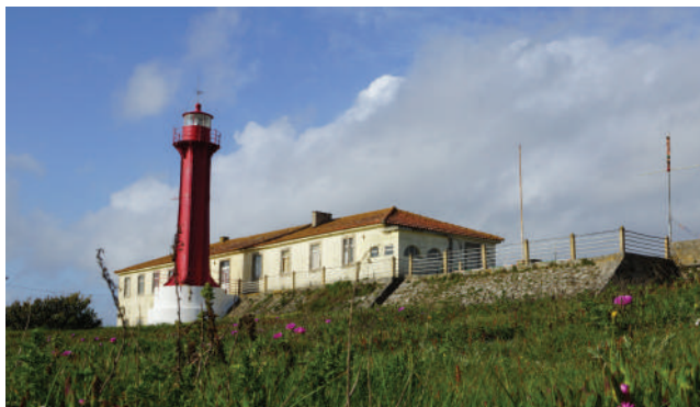
FORTE DE S. JOÃO BAPTISTA