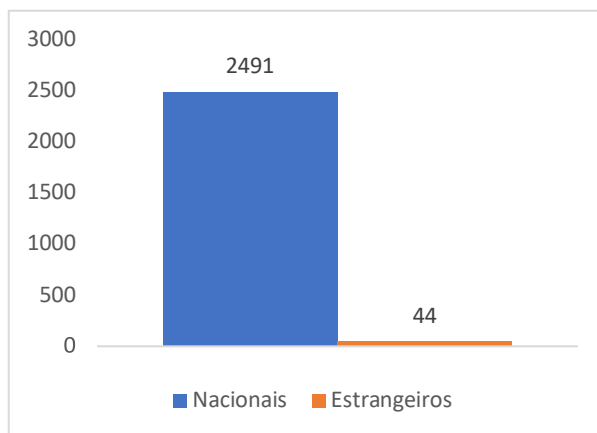
Gráfico 2. Visitantes do Museu no ano de 2020

No que respeita ao público que visita o Museu da Graciosa ou participa nas suas atividades, esta instituição no ano de 2020 recebeu um total 2.535 pessoas. Deste número, 2.491 (98,26%) são visitantes nacionais e 44 (1,74%) são estrangeiros, conforme apresenta o gráfico 2.