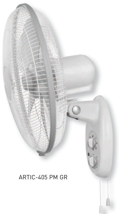
ARTIC-405 PM GR