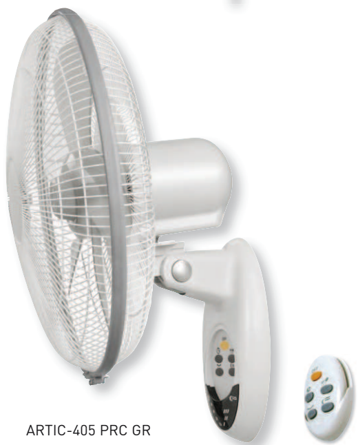
ARTIC-405 PRC GR

Ventiladores de parede que dispõem de 3 velocidades, temporizador, e grelha de segurança desmontável.