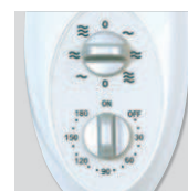
Artic 405 PM GR: seletor de velocidades e temporizador.