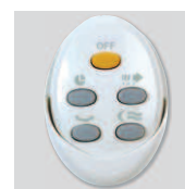
Artic-405 PRC GR: comando à distância.