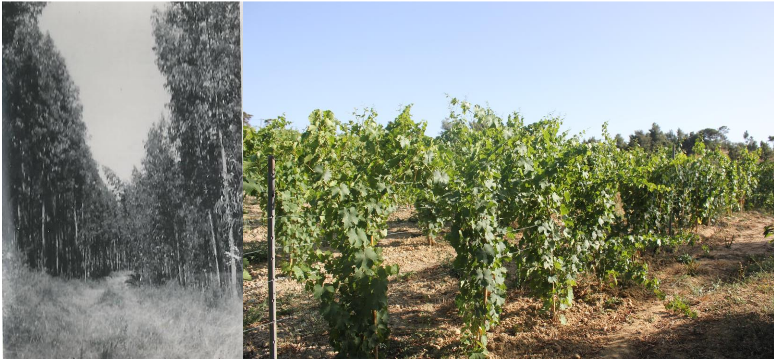
A MESMA PARCELA EM 1950 E EM 2018