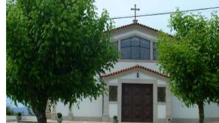
Igreja Paroquial de Remelhe