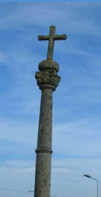
Cruzeiro de Chavão