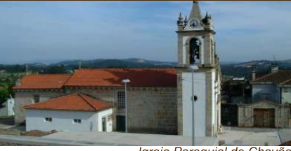
Igreja Paroquial de Chavão