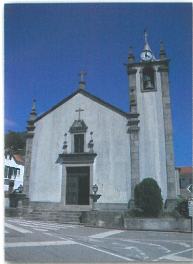
Igreja Matriz de Rocas do Vouga