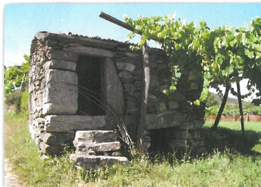
Moinho em Sanfins

Marcação, Sinalização e Conceção Gráfica: NaturBarroso www.termontalegre.net geral@naturbarroso.net Tel. 276 518 125 / 935 663 060/8