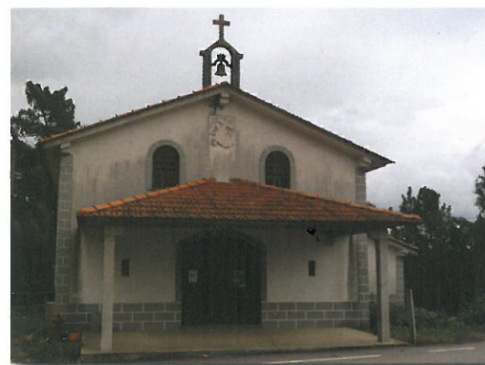
Capela em Irijó