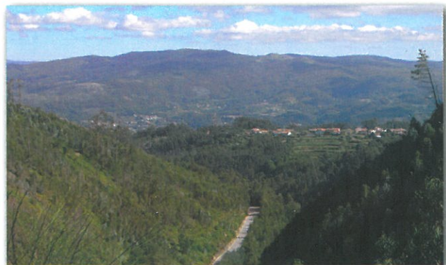
Vista Sobre o Vale do Rio Gresso

O percurso desenvolve-se por caminhos agrícolas e florestais, estradas de ligação entre algumas aldeias da freguesia de Rocas do Vouga e ao longo da levada do Gresso. É também serpenteado por várias levadas de água que a direccionam à linha de moinhos que existe ao longo das margens do Rio Gresso. Passa também dentro da Quinta do Linheiro, pertencente à Fundação Bernardo Barbosa de Quadros, onde se pode observar a dinâmica agrícola, com especial destaque para os mirtilos, local onde foram feitas as primeiras experiências de introdução deste fruto no concelho de Sever do Vouga.