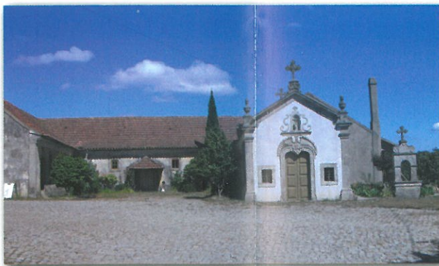
Capela do Linheiro

Ao longo deste percurso também se pode perceber a fé que estas comunidades têm com a Igreja e em especial, no culto dos santos, devido à passagem por capelas (Linheiro e Irijó), cruzeiros (Souto Chão) e alminhas (Sanfins, Irijó e Rocas). Este facto confere a este percurso um cunho cultural diferenciador dos restantes percursos de carácter mais paisagístico.