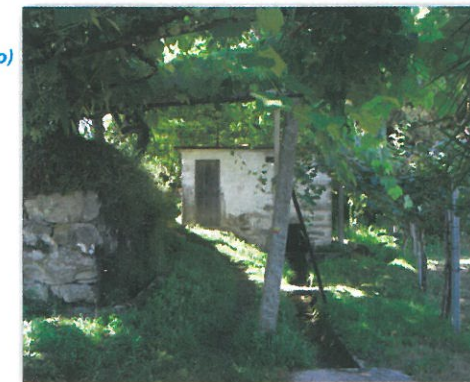
Levada e Moinho em Sanfins

Não muito distante encontra-se o da Serralheira. Edificado, obedecendo às regras da arquitetura popular e aos materiais tradicionais, está em melhor estado de conservação que o anterior, apesar de algumas alterações provocadas por recentes adaptações.