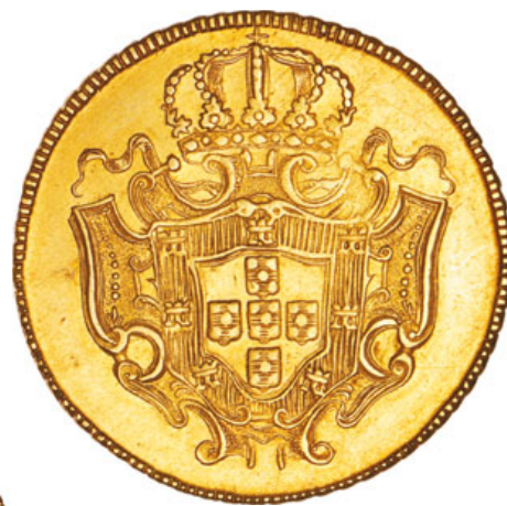
156* Ouro Peça 1733 M (G.132.04; JS J5.130; AI O281)