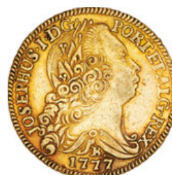
quase BELA 700.