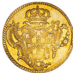
236* Ouro Peça 1776 R (G.55.30; JS Jo.79; AI O444)