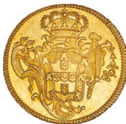
206* Ouro Peça 1776 B (G.54.29; JS Jo.52; AI O406)