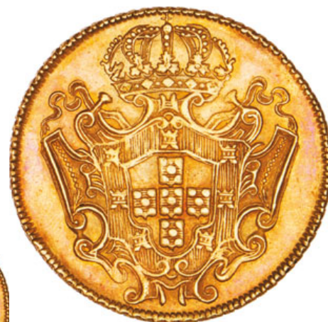
123* Ouro Dobra 1732 M (G.139.08; JS J5.29; AI O288)

EXCELENTE ESTADO DE CONSERVAÇÃO E TONALIDADE