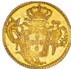
234* Ouro Peça 1775 R (G.55.29; JS Jo.78; AI O443)