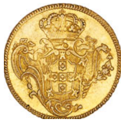
204* Ouro Peça 1774 B (G.54.27; JS Jo.50; AI O404)