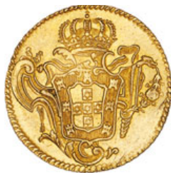
232* Ouro Peça 1774 R (G.55.28; JS Jo.77; AI O442)