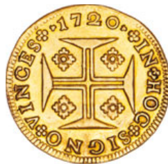
157* Ouro Moeda 1720 (G.98.16; JS J5.145) v.s.