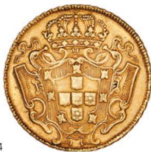
124* Ouro Dobra 1732 M (G.139.08; JS J5.29; AI O288)