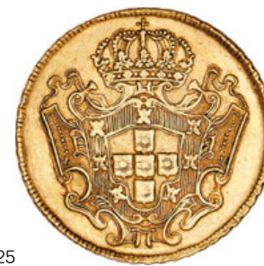
125* Ouro Dobra 1732 M (G.139.08; JS J5.29; AI O288)