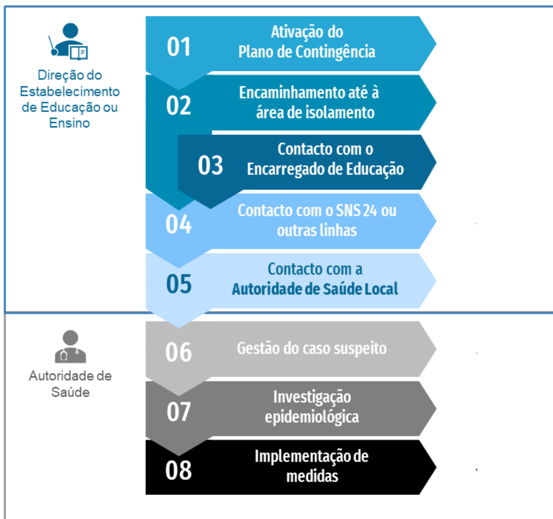
Figura 1. Fluxograma de atuação perante um caso suspeito de COVID-19 em contexto escolar