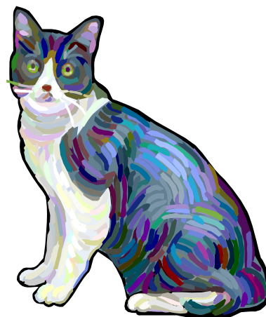
Um gatarrão fugiu.