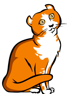
Um gato fugiu.