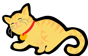
Um gatinho fugiu.