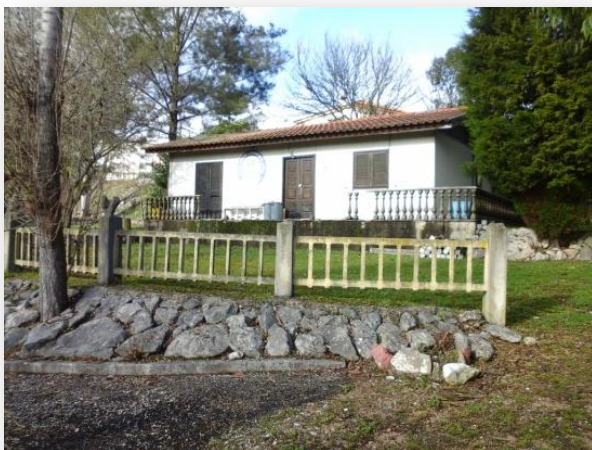
Fig. 3 - Antigo Clube de Campismo (captura de imagem)