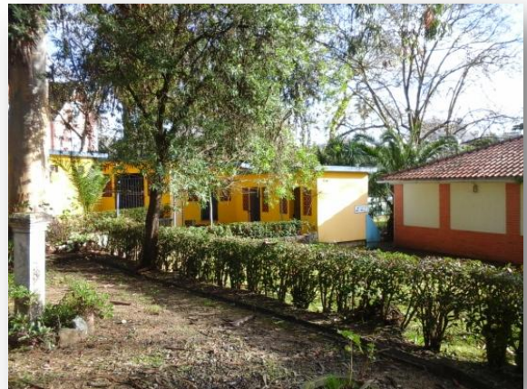
Fig. 2 – Balneários e Zona de churrasco (captura de imagem)