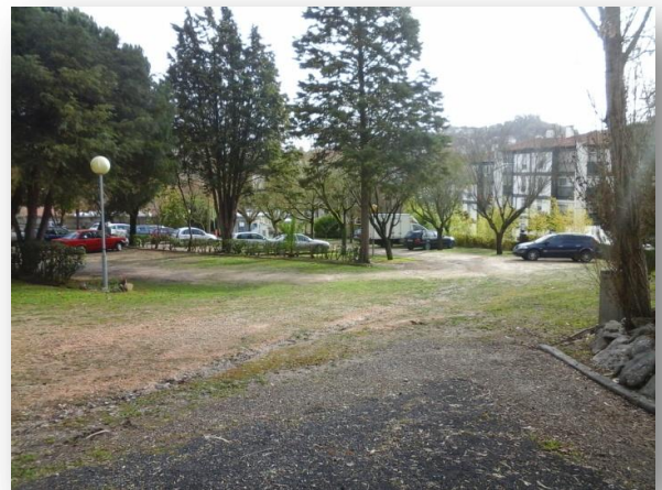
Fig. 4 – Espaço que, atualmente, funciona como parque de estacionamento público (captura de imagem)