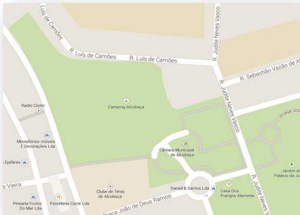
Fig. 1 – Localização do espaço

Ao nos dirigirmos ao local e analisarmos o mesmo, verificámos que é uma área inclinada, dividida em vários setores. Contempla um amplo espaço verde com várias árvores antigas e de grande porte, bem como estruturas adjacentes (portaria, zona de churrasco, balneários, clube de campismo) inutilizadas atualmente. É uma zona vedada que se localiza próxima da área comercial, e recente área central, da cidade de Alcobça, isto é, numa área de grande acessibilidade.