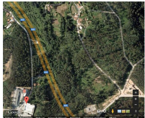
Fig.3 – Rua Qta. D'Além