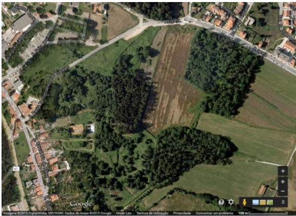
Fig.5 – Rua Padre Tomas de Aquino Silvaes