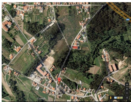
Fig.4 – Rua da Covinha