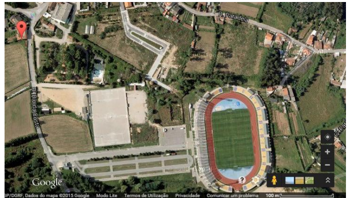
Fig.6 – Rua Rio da Costa

Destacar que durante a procura de informação para o nosso projeto estabelecemos contactos com algumas entidades das quais obtivemos os seguintes registos: