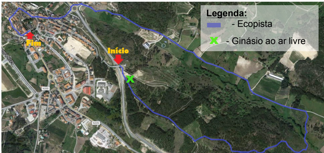
Mapa 1 – Localização cartográfica do projeto