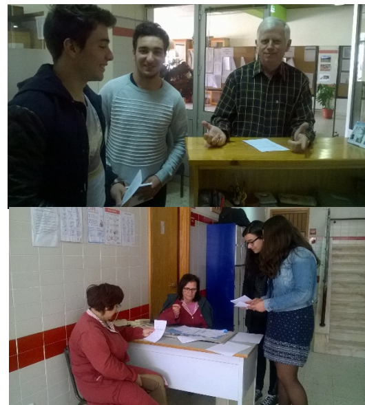
Figura 2- Realização dos Questionários

Ainda que tenhamos feito os questionários a apenas 30 pessoas conseguimos tirar algumas conclusões. Podemos ver o descontentamento da população face as estruturas existentes no concelho e podemos observar que existe um desejo de criação de estruturas para a possibilidade de práticas de desporto ao ar livre e a vontade de participação em percursos de orientação.