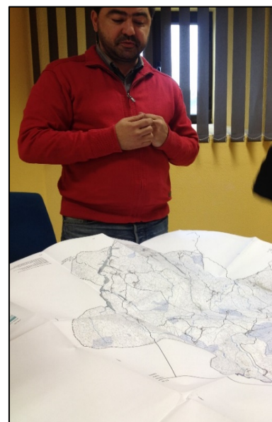
Figura 1- Discussão acerca do PDM.