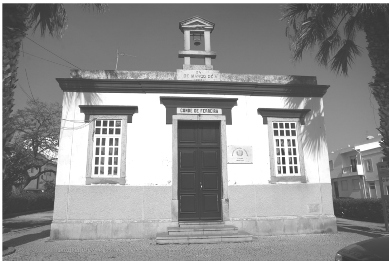
fachada da sede actual, a antiga Escola Primária “Conde Ferreira”

como muitos outros que dessa forma governavam a vida em Lagos – entrou, descalço e em trajes menores, pela sede adentro. Pretendia apenas uma sanduíche de moreia, à laia de “mata-bicho”. Ir à Filarmónica “comer uma bucha” fora pois, a sua principal preocupação, logo ao saltar para terra, depois de uma noite na faina do mar.