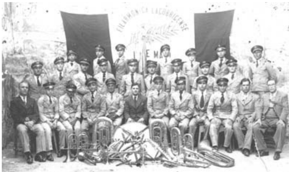
A Banda da S.F.L. 1º de Maio em meados dos anos 30