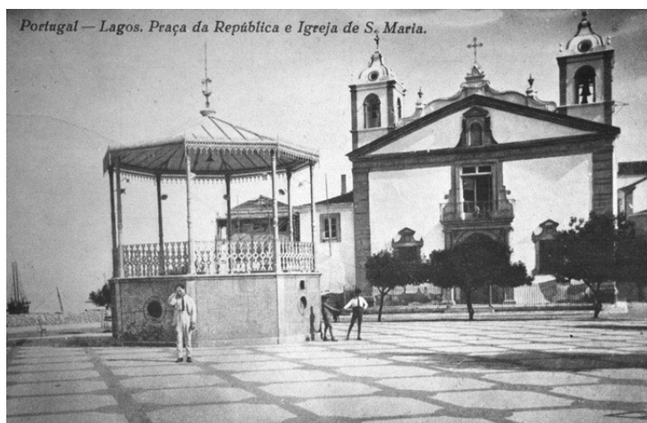
foto coreto antigo existente na Praça da República

de 1946/47 vários eram os músicos que não se apresentavam no coreto, ao lado dos seus colegas, devido à grande falta de fardas. Só muito posteriormente esta situação seria remida e afastada como problema endémico na S.F.L. 1º de Maio.