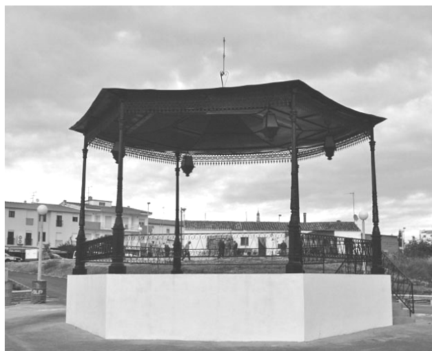
o coreto actual, vendo-se em segundo plano a habitação antiga que ocupa o local onde deverá ser edificada a nova sede da SFL

No primeiro ano do novo milénio Lagos inaugurou um coreto, de construção modesta e localização deficiente, não obstante situar-se num pequeno parque urbano adjacente à artéria da cidade que ostenta o nome da filarmónica local e para onde se prevê a implantação da futura sede da Associação.