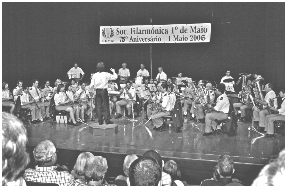
actuação no dia 1º de Maio no Centro Cultural de Lagos