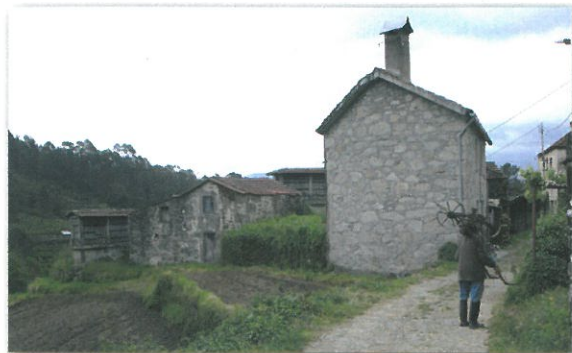
Aldeia de Catives