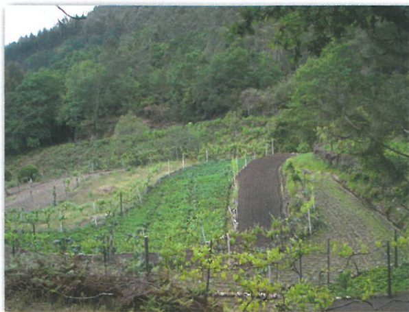
Terrenos cultivados em Catives

Este percurso é ainda marcado pelas paisagens de terrenos agrícolas que são cultivados nas aldeias de Catives e da Cerqueira, identificando a presença de uma prática agrícola de minifúndio que se mantém ainda nesta encosta da montanha, reforçada pela presença de alguns exemplares de canastros, símbolos da freguesia de Couto de Esteves e que se podem encontrar disseminados por este território.