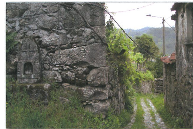
Aminhas e Caminho Tradicional em Catives

O percurso da Pedra Moura leva-nos também a conhecer o registo histórico/patrimonial mais antigo da freguesia de Couto de Esteves – a Anta da Cerqueira - monumento megalítico, testemunho da presença de pequenas comunidades humanas em Couto de Esteves, há cerca de 5000 anos atrás.