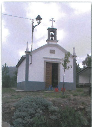
Capela da N. Sra. da Boa Viagem em Cerqueira

O percurso desenvolve-se por caminhos florestais, ao longo de levadas de regadio, nas margens do rio Gresso e por antigos caminhos pedonais de ligação entre as aldeias a Norte e a sede de freguesia de Couto de Esteves, passando pelos locais de culto das almas do purgatório – as alminhas, e por algumas capelas que podem ser visitadas, nomeadamente na aldeia de Catives (N. Sra. da Boa Hora) e na aldeia da Cerqueira (N. Sra. da Boa Viagem).