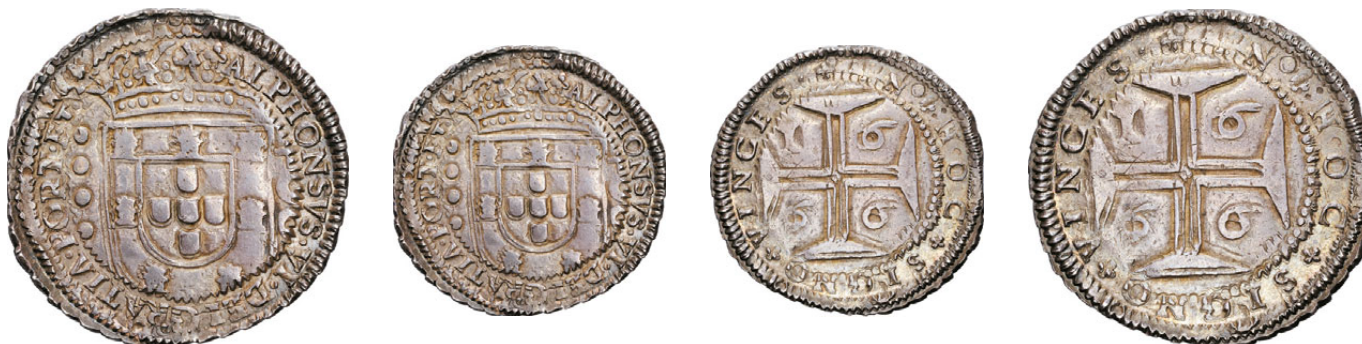
103* Cruzado 1666 de D. Afonso VI com cordão e cunho de orla nova