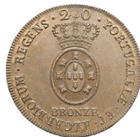
285* 20 Reis 1811 BRONZE E 2.01