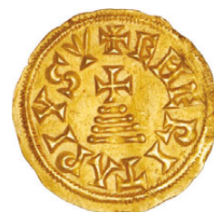
13* Wamba (672-680) Ouro Triente Emerita CNV 479c; 1,46g.