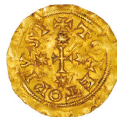
14* Witiza (700-710) Ouro Triente Toledo CNV 611 var.; 1,39g.