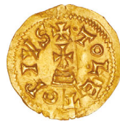
12* Recesvinto (649-672) Ouro Triente Toledo CNV 454.6; 1,47g.