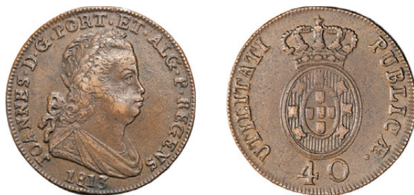
284* Pataco 1813 09.04