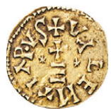
15* Egica e Leovigildo Lote (2 moedas) (Falsas)