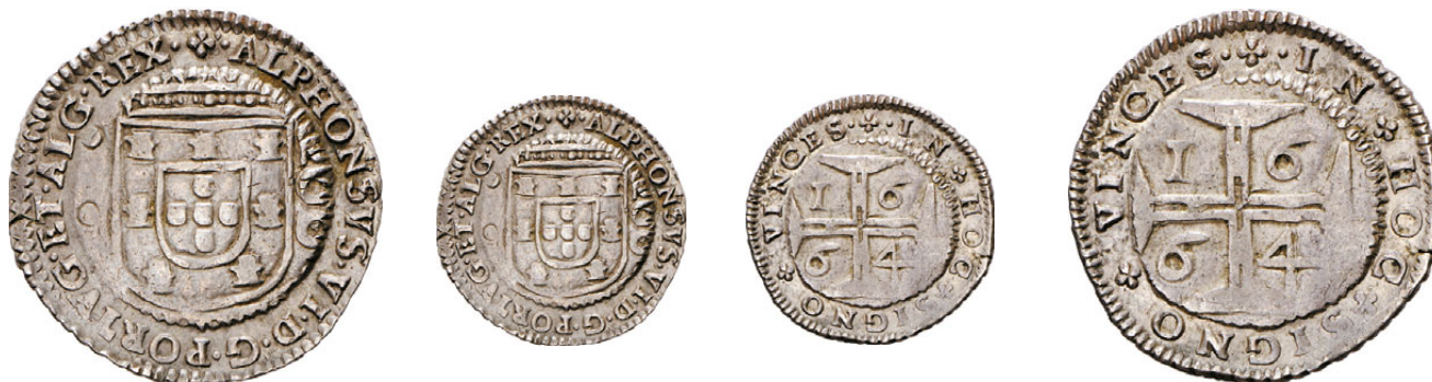
104* Meio Cruzado 1664 de D. Afonso VI com cordão e cunho de orla nova