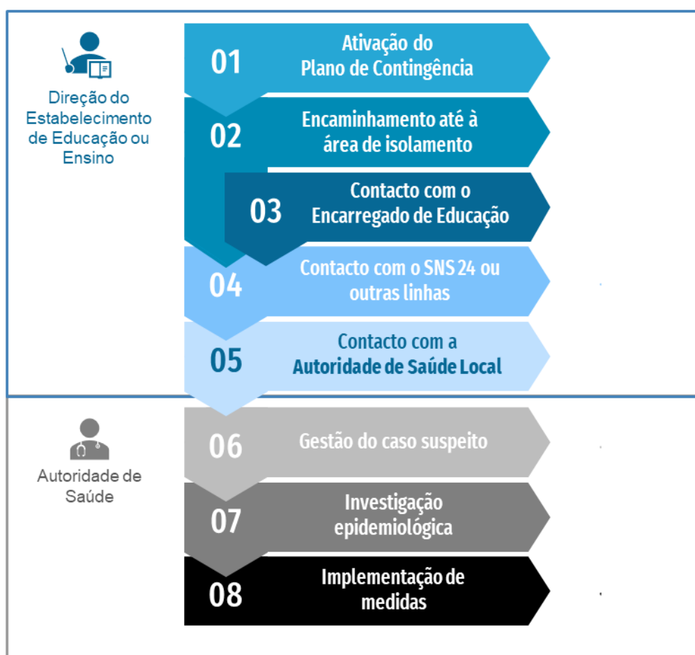
Figura 1. Fluxograma de atuação perante um caso suspeito de COVID-19 em contexto escolar

4.º) Na área de isolamento, o encarregado de educação, ou o próprio se for um adulto, contacta o SNS 24 ou outras linhas criadas para o efeito e segue as indicações que lhe forem dadas. O diretor ou o ponto focal do estabelecimento de educação ou ensino pode realizar o contacto telefónico se tiver autorização prévia do encarregado de educação.