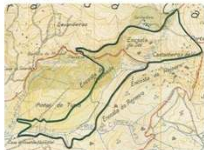
Fonte: Carta Militar n.º 38 do Instituto Geográfico do Exército