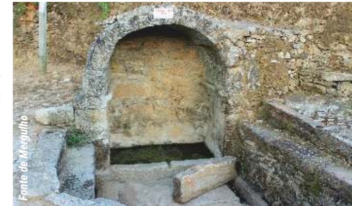
Fonte de Mergulho

surrounding walls. Leaving the housing nucleus we cross a country road where there are abundant olive groves and the vineyards so remarkable of this region. We head to the Castro of Vilarinho dos Galegos, also known as the Castle of the Moors. A little further ahead we find a natural viewpoint