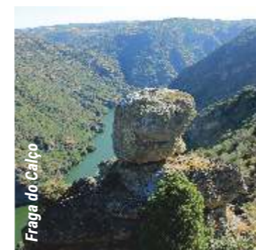
Fraga do Calço

This route is part of the Pedestrian Route Network of the Mogadouro county. It has approximately 5,6 km long starting in the square in front of the Parish Council, next to the fountain, in Vilarinho dos Galegos. Turning right, a few meters ahead, we can visit the main Church and appreciate some elements that decorate the