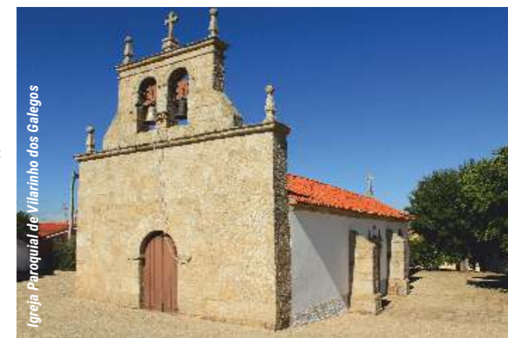
Igreja Paroquial de Vilarinho dos Galegos

over the river Douro, in Fraga do Calço. We go down and enjoy the panoramic view of the hillside, which appears before us, until we reach the stream, which is bordered by ash and willow trees, and offers us a small waterfall and a natural lagoon. On the other side of the stream, we follow the path known as the path of contraband, which, in the past, was used by many people, in search of a better life. Along the way we enjoy different types of vegetation that cover the slopes of the river, among them, junipers, hawthorns, olive trees, cork oaks, stems and gorses. Arriving at the village, we can contemplate a beautiful diving fountain and then a small bridge over the river. During the final meters we appreciate some architectural details of the typical and well preserved houses of the village.