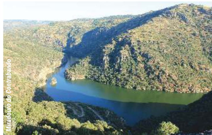
Miradouro do Contrabando

Galegos, também conhecido pelo Castelo dos Mouros, um pouco mais adiante, encontramos um miradouro natural sobre o rio Douro, na Fraga do Calço. Descemos e usufruímos da vista panorâmica para a encosta de zimbros, que surge à nossa frente, até chegarmos à ribeira, esta, ladeada por freixos e salgueiros, na qual existe uma pequena cascata e lagoa naturais. Já na outra margem, seguimos até ao caminho conhecido pelo caminho do contrabando. Em outros tempos, era feito por muitos que iam em busca de uma vida melhor. Ao longo do caminho usufruímos de diferentes tipos de vegetação que cobrem as encostas sobre o rio, entre elas, os zimbros, os pilriteiros, as oliveiras, os sobreiros, as estevas e os giestais. Ao chegar à aldeia, podemos contemplar uma bonita fonte de mergulho e, de seguida, uma pequena ponte sobre a ribeira. Durante os metros finais, apreciamos alguns pormenores arquitectónicos das casas tipicamente transmontanas e bem preservadas da aldeia.