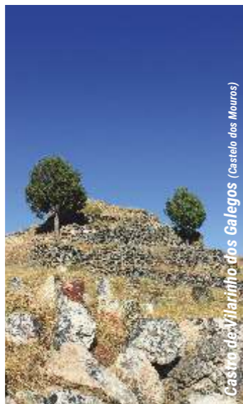
Castro de Vilarinho dos Galegos (Castelo dos Mouros)

Este percurso, faz parte integrante da Rede de Percursos Pedestres do Concelho de Mogadouro. Tem aproximadamente 5,6 km, com início no largo em frente à sede da Junta de Freguesia, junto ao fontanário, em Vilarinho dos Galegos. Seguindo pela direita, alguns metros à frente, podemos visitar a Igreja Matriz e apreciar alguns elementos que se encontram a decorar os muros circundantes. Saindo do núcleo habitacional percorremos um caminho rural onde são abundantes os olivais e os vinhedos tão marcantes desta região. Com destino ao Castro de Vilarinho dos