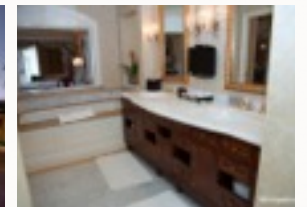
Hotel visto de fora Uma das divisões do hotel