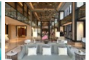
Piscina interior Entrada principal