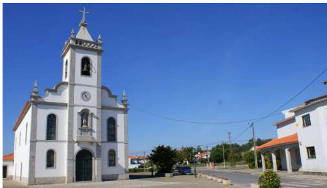
IGREJA MATRIZ DE VILA CHÃ