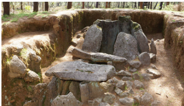
DÓLMEN DO RAPIDO