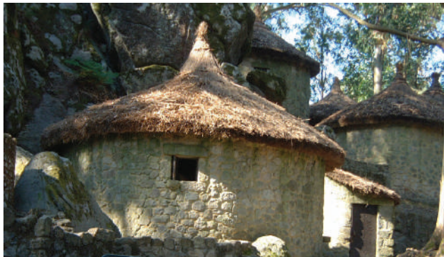
CASTRO DE S. LOURENÇO