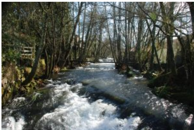
1 – Pontes de Panque