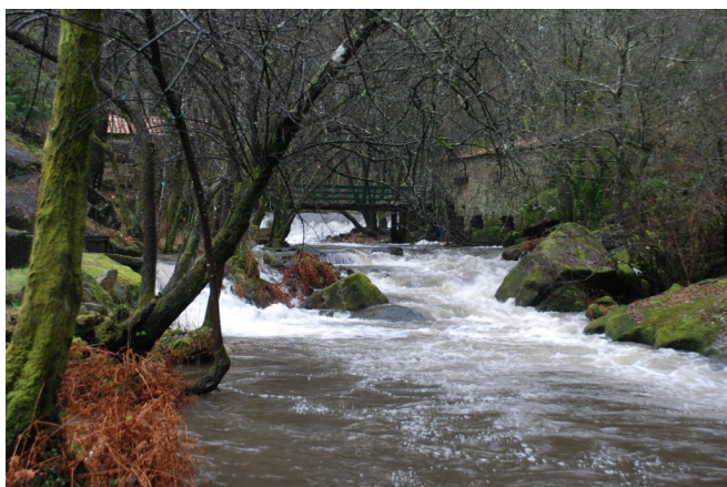
2 – Moinhos de Fulão