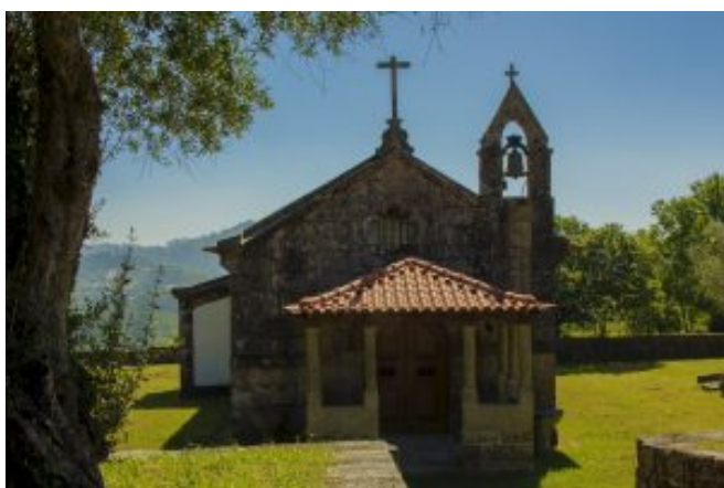
6 – Igreja de S. Martinho de Balugães