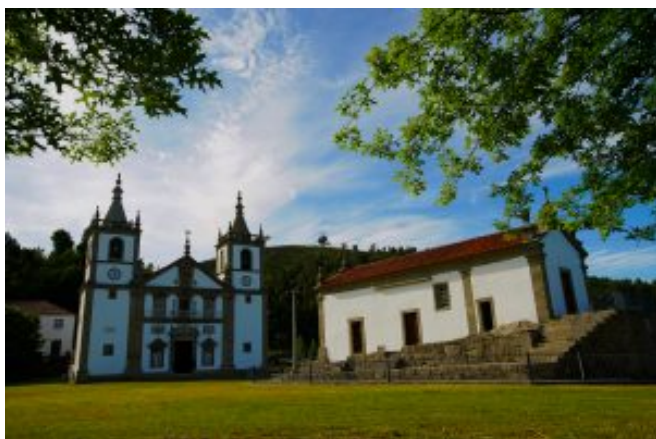
5 – Santuário de N a Sra da Aparecida