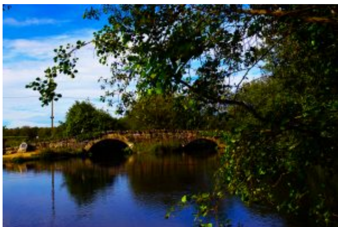
4 – Ponte das Tábuas