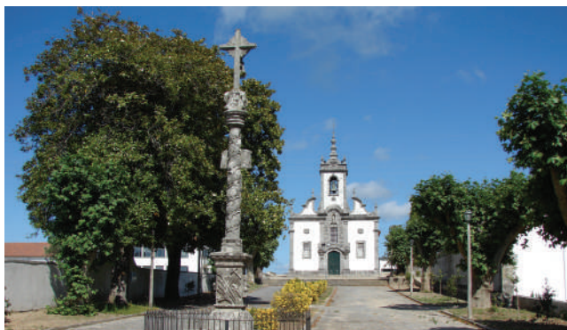
CRUZEIRO E IGREJA MATRIZ DE ANTAS