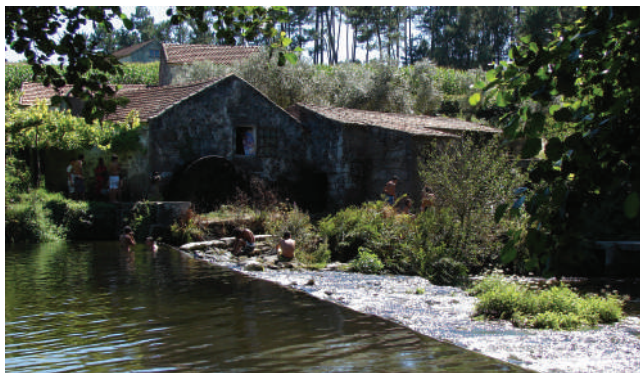
AZENHA DO MINANTE