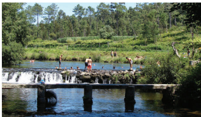
AZENHA DO MINANTE