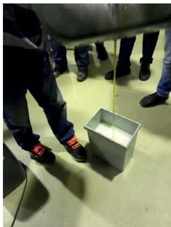
Figura 1. Execução da mistura do fluido de corte.

Recordamos que uma emulsão ou solução de fluido de corte é composta por 2 a 10% de fluido de corte e 90 a 98% de água. A ordem de mistura é a seguinte: adiciona-se na composição de água o fluido de corte, conforme a Figura 1.