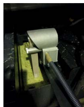
Figura 3. Skimmer em funcionamento no tanque de armazenamento das emulsões no centro de maquinação CNC – Núcleo de Amarante do CENFIM.