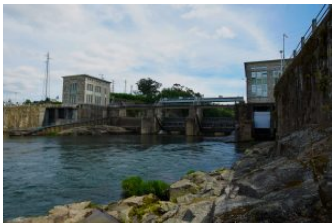
2 – Barragem de Penide