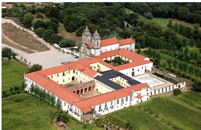
1 – Mosteiro de Tibães