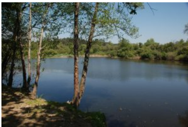
3 – Lagoas de Caíde