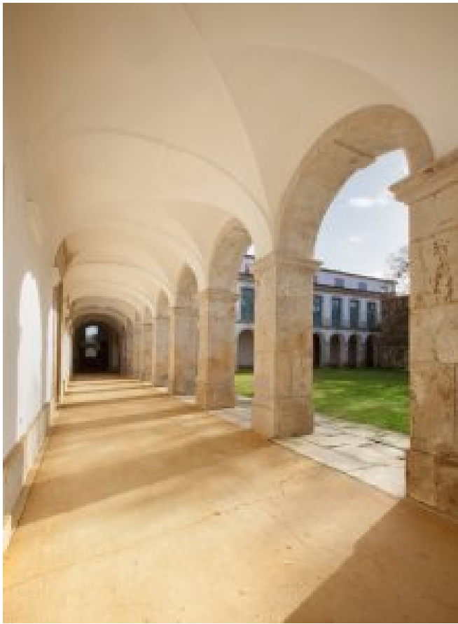
6 – Convento de Vilar de Frades