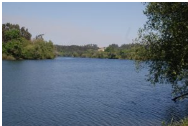
4 – Rio Cávado