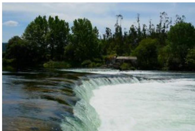
5 – Açude Areias