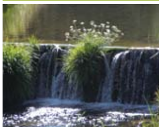
Queda de Água