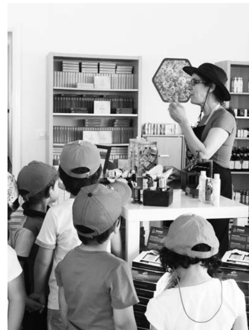
Saída de Campo em Segura com visita à Quinta do Valado

Relativamente às saídas de campo, a grande novidade do Ano Letivo 2015/2016 é a criação da Saída de Campo de dois dias “Uma viagem pelo Ciclo das Rochas no Centro de Portugal”, resultante de uma parceria estabelecida entre o Geopark Naturtejo e as Grutas da Moeda, ambos parceiros do Roteiro de Minas e Pontos de Interesse Mineiro e Geológico de Portugal. Esta atividade inclui visita às Grutas da Moeda e ao Centro de Interpretação Científico-Ambiental (CICA) das Grutas da Moeda (Fátima), à Rota dos Fósseis em Penha Garcia e à Rota dos Barrocais em Monsanto. Esta saída de campo destina-se a alunos do 3º Ciclo do Ensino Básico e do Ensino Secundário.