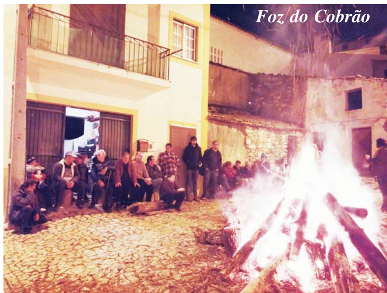
Foz do Cobrão

Imagens que nos chegaram da tradicional fogueira de Natal nas nossas aldeias