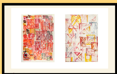
Na foto: "Quando?" e "Ribas", de Tomás Moreno