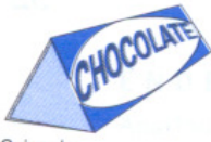
Caixa de chocolates

Descobri estes objectos na minha casa. Será que me podes ajudar a descobrir algumas das suas características?