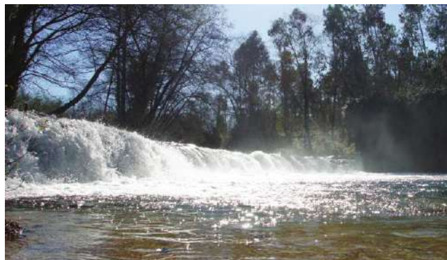
AZENHA DO GRILLO