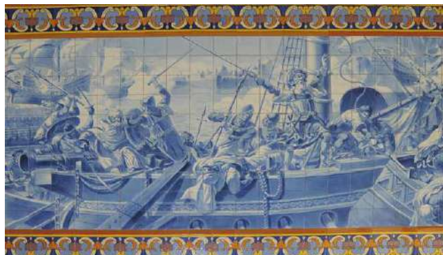
PAINEL DE AZULEJOS DE JORGE COLAÇO