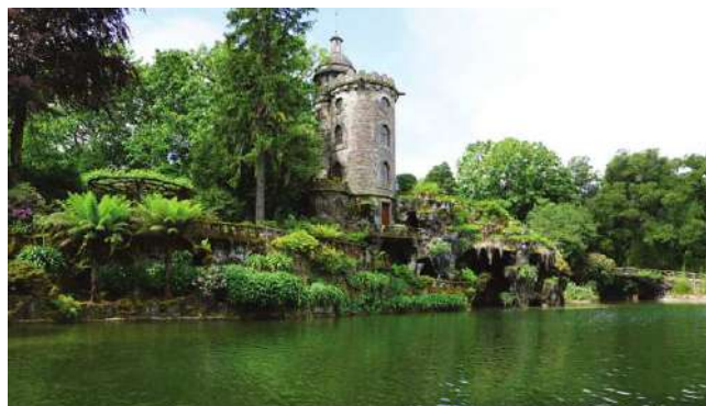
QUINTA DE CURVOS