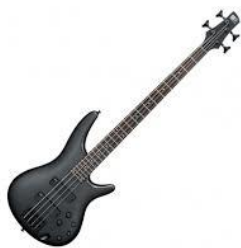
Baixo Elétrico (4 cordas/som grave)