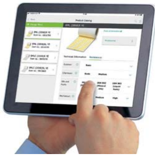
Figura 4. A lista de produtos mostra todas as informações técnicas incluindo resistências e acessórios.

Após a solução ter sido escolhida, a app pode ser utilizada para efetuar a introdução de texto a marcar e enviar para a impressora diretamente via Bluetooth (disponível em Android). Esta funcionalidade permite a possibilidade de utilização do sistema de marcação em obra, por exemplo. Etiquetas frequentemente utilizadas estão disponíveis na opção de comparação ou em projetos gravados.