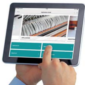
Figura 2. A aplicação em IOS tem os seguintes critérios: aplicação, resistência, aprovações e propriedades do material.

A “ Marking system ” app da Phoenix Contact torna isto possível. Conforme a versão do seu sistema portátil, android ou outro, a app disponibiliza um guia de aplicações simples e intuitivo (Figura 2).