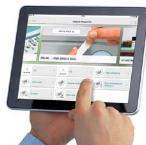
Figura 3. Na área propriedades do material, as especificações da aplicação são visualizados.

automaticamente o grupo de produtos pelas escolhas do utilizador. Filtros adicionais são possíveis, tais como tipo de impressora, dimensão e cor. Os resultados são visualizados em tempo real (Figura 3).