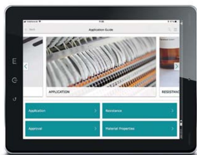
Figura 1. O guia de aplicação da Marking app encontra a solução ideal de marcação para todas as aplicações industriais.

Qual a marcação ideal para a minha aplicação? O tema da marcação industrial tornou-se menos complexo graças à transformação digital. A Phoenix Contact desenvolveu uma app que dá a resposta. O utilizador chega à solução apropriada através do guia de aplicação da app , podendo visualizar as características técnicas da solução final.