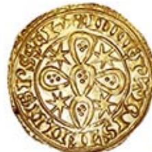
+ SANCIVS EX RTVGALIS * + INNE PTRIS I FILIISPSCIA RARA