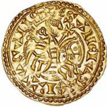
4* Ouro Morabitino (04.02); 3,74g.