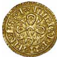
+SANCIVS REX PORTVGALIS +INNEPTRIS I FILII SPS SCIA RARA