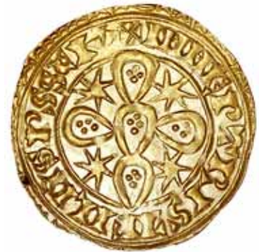
BELA 12 000.