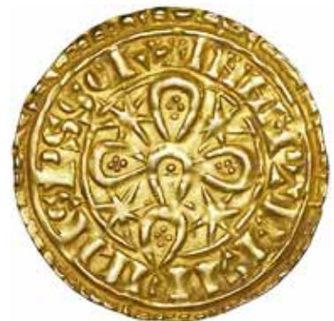
SOBERBA 11 000.