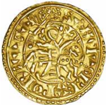
5* Ouro Morabitino (04.08); 3,75g.