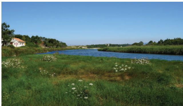
FOZ DO RIO NEIVA