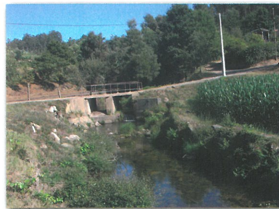
Ribeira de Carrazedo

Atualmente apenas um funciona, mas a paisagem lúdica e centenária, as misteriosas histórias e lendas que se contavam baixinho enquanto se aguardava pacientemente pelo girar da mó, dão conta da importância que a moagem teve durante largos anos junto da comunidade agrícola da freguesia e do concelho. Acompanhando as águas da Ribeira, deparamo-nos com uma pequena ponte de madeira, que nos leva até ao moinho do Fundo do Vale, integrado numa paisagem de rara beleza.