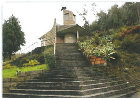
Capela de S. Eufémia

Marcação, Sinalização e Conceção Gráfica: NaturBarroso www.termontalegre.net geral@naturbarroso.net Tel. 276 518 125 / 935 663 060/8