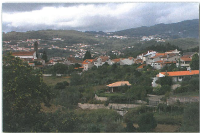
Aldeia de Paradela

Ao longo deste percurso também se pode perceber a fé que estas comunidades têm com a igreja e em especial no culto dos santos com a passagem nas capelas de Nossa Senhora da Boa Hora (Penouços), Santa Eufémia (Soutelo) e em alguns exemplares de Alminhas.