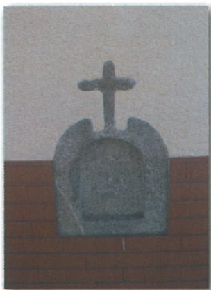
Alminhas em Paradela

Este percurso acompanha muitas vezes as águas da Ribeira e os socalcos serpenteados por levadas e por laranjais, dando a este trilho um valor acrescentado em termos de contacto com a natureza por quase não passar por aglomerados. Remata com a chegada ao lugar do Soutelo junto a um Cruzeiro de granito que ficou a substituir a antiga capela da Sta. Eufémia já inexistente.