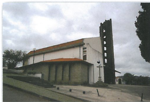
Igreja Matriz de Paradela