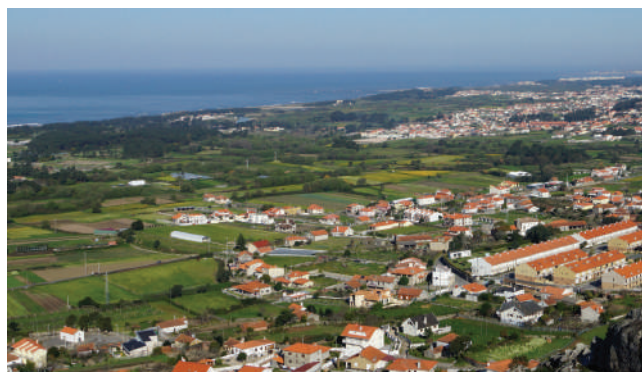
VISTA DO MONTE DA S.R.A DA GUIA