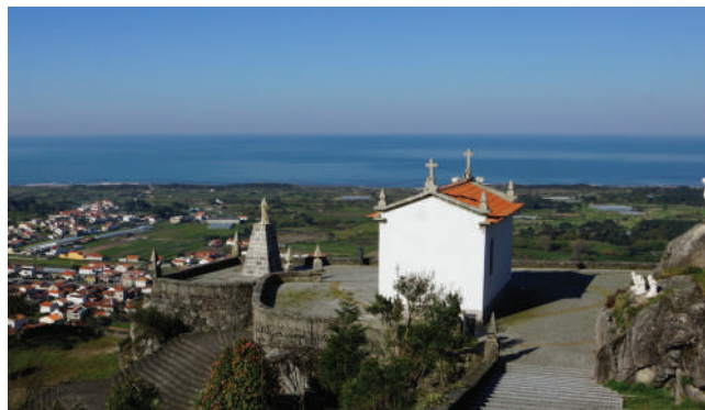
S.R.A DA GUIA