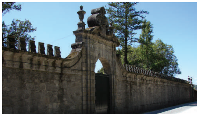
QUINTA DE BELINHO